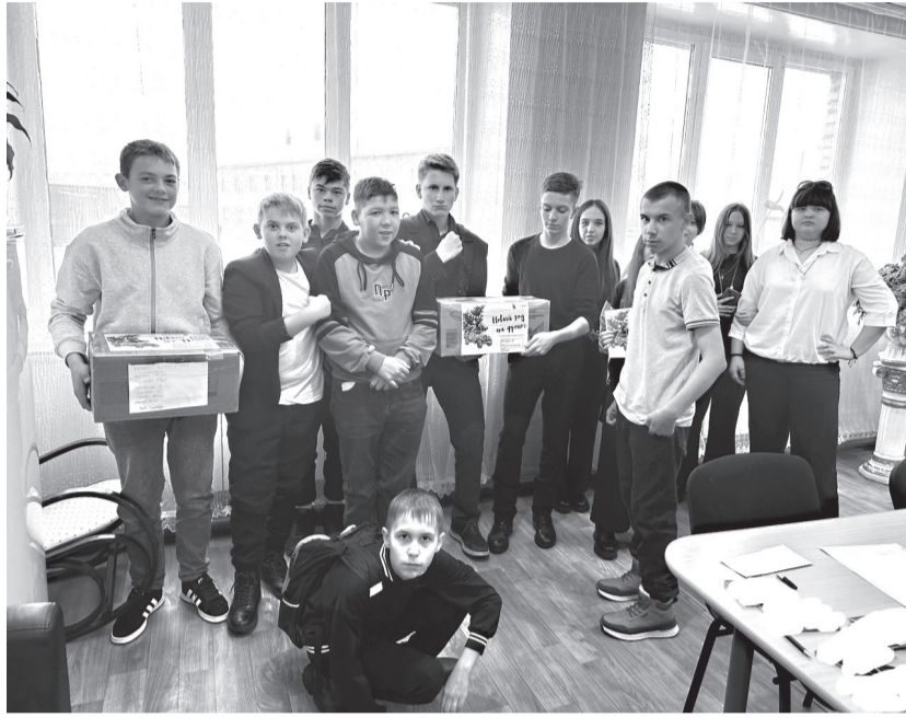
Учащиеся Идринской сош с посылками для участников СВО

Жители села Никольского, присоединяясь к акции "Поздравь солдата с Новым годом!", передали нашим землякам вязаные носки и рукавицы. Эта акция проводится с 20 ноября по 15 декабря в поддержку участников специальной военной операции.