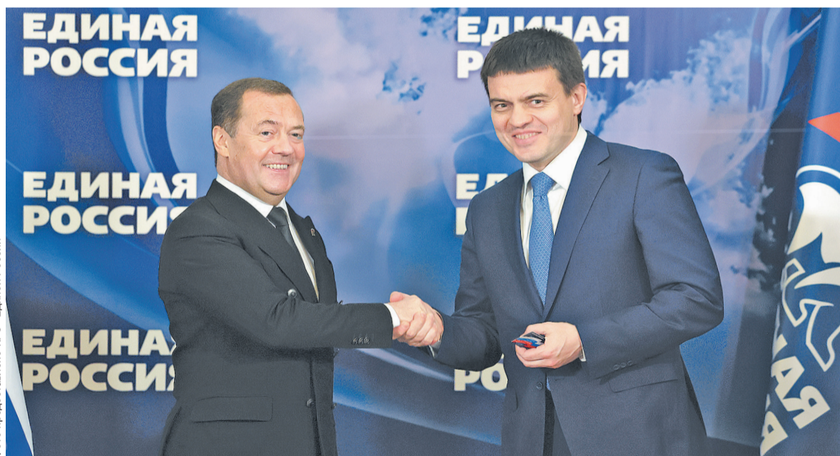
Председатель «Единой России» Дмитрий Медведев и губернатор края Михаил Котюков

Партия «Единая Россия» приняла решение об обновлении руководящего состава своих региональных отделений в шести субъектах Российской Федерации, в том числе и в Красноярском крае.