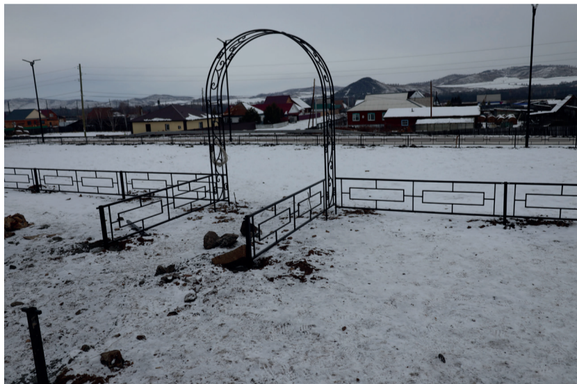
В Идринском благоустраивается видовая площадка «К звездам» – здесь можно будет отдохнуть и полюбоваться селом

Красота, скажу я вам, открывается оттуда, сверху, необыкновенная. Красиво наше село и его окрестности, а благодаря неравнодушным, болеющим за свою родину людям оно станет еще лучше. Нужно только беречь ту красоту,