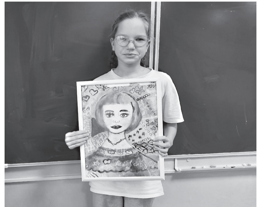
Рисунки Софьи Юрковец, 4 «В», Идринская сош