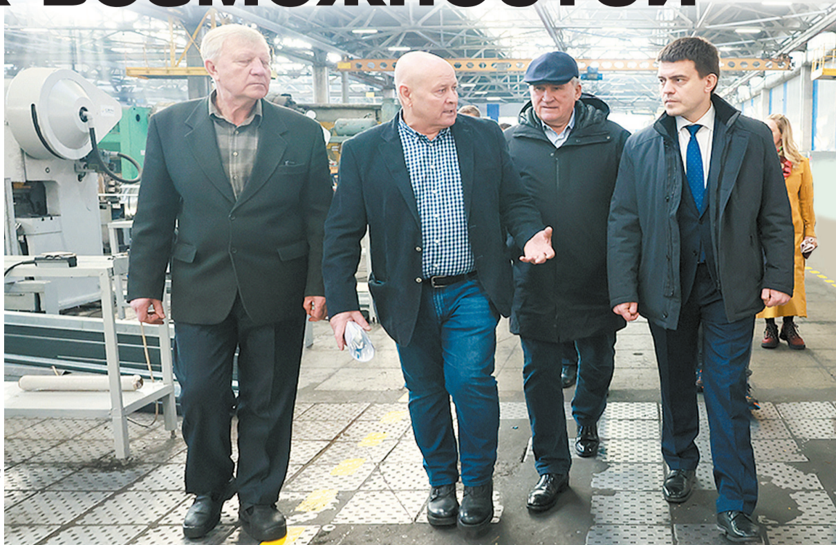
По поручению губернатора в крае разрабатывается программа для запуска промышленной площадки на территории бывшего завода автоприцепов Сосновоборска

» – Завод и город Сосновоборск неразрывно связаны друг с другом. Сейчас главная задача – найти решения, которые позволят запустить производственную площадку. Это даст новые рабочие места городу, меньше его жителей будет ез-