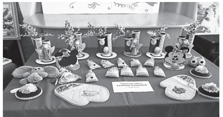
Работы Галины Хлоповой