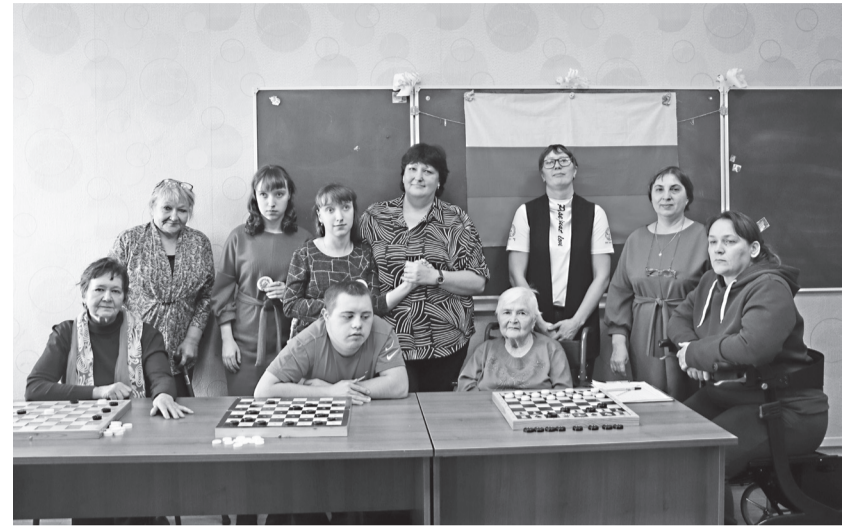
На мероприятии в комплексном центре социального обслуживания

Прошли соревнования среди граждан, имеющих инвалидность, под девизом «Спорт без границ». В программу вошли игра в шашки и спортивные эстафеты. Участники соревнований показали хорошие результаты во всех видах спорта. По итогам соревнований были определены победители, которые награждены медалями и грамотами. Все