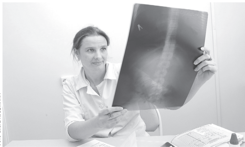
Увеличены штаты врачей и среднего медперсонала

Депутаты вместе с министерством здравоохранения проанализировали все обращения и жалобы пациентов. И эта работа дала свои результаты.