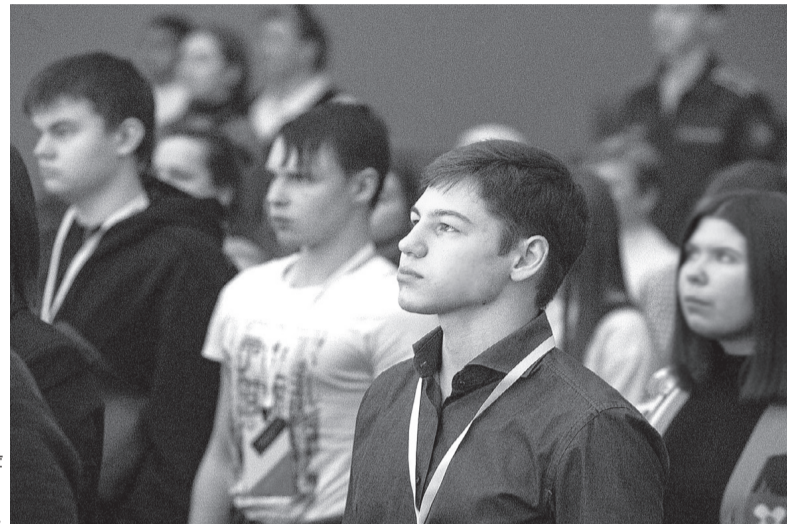
В работе форума участвуют школьники и студенты