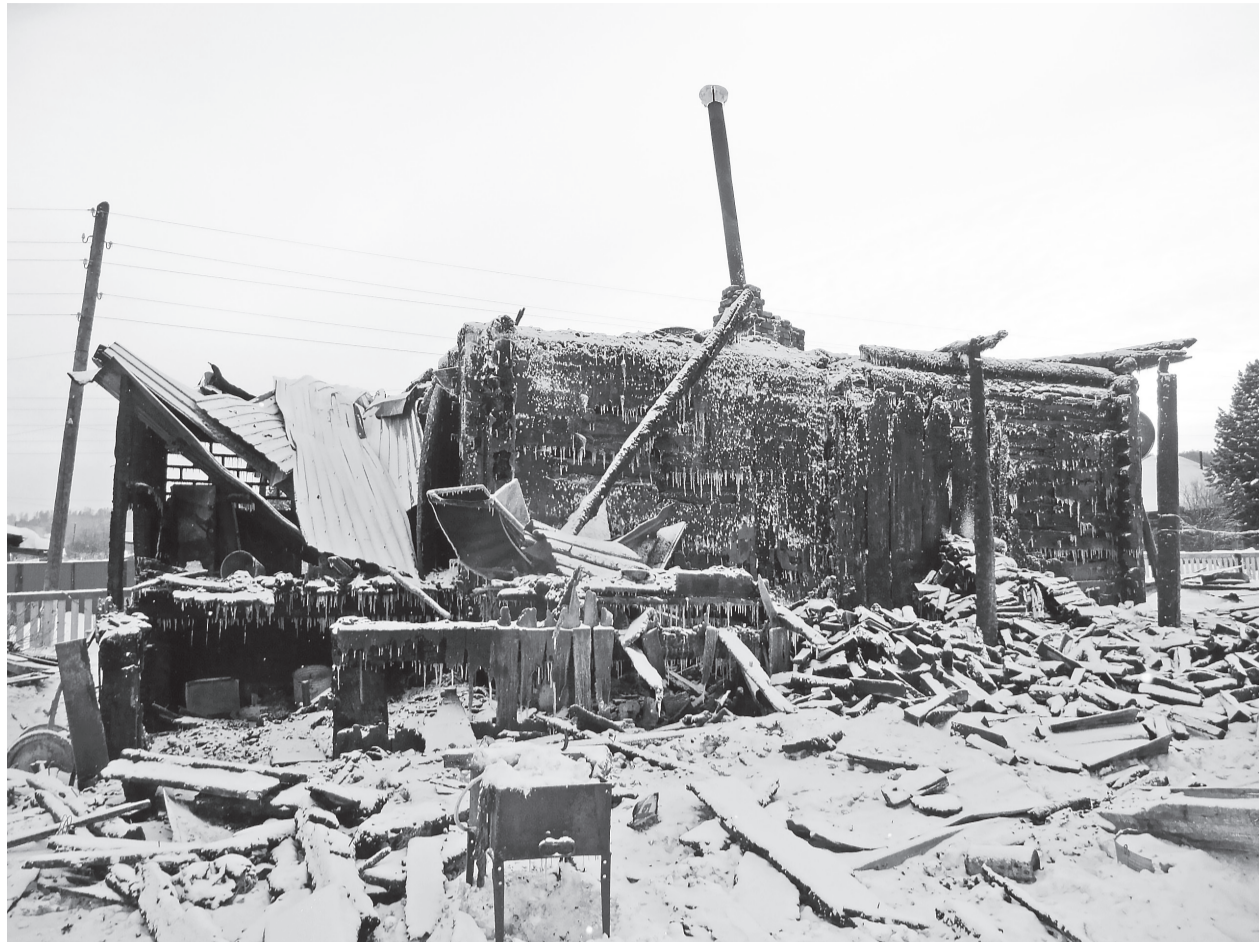
В селе Отрок 14 декабря произошел пожар в одном из домов. Вот что от него осталось

С приходом зимы и сильных морозов люди в жилом секторе начинают интенсивнее подкидывать в печь угля, порой не задумываясь о пожарной безопасности. А ведь несоблюдение простых правил может привести не только к пожару, но и к гибели людей.