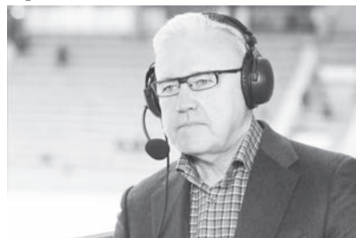
Александр Усс, губернатор Красноярского края

На минувшей неделе состоялось заседание президиума Координационного совета при Правительстве России. Оно было посвящено борьбе с эпидемией. Как известно, в мире распространяется новый штамм коронавируса. И важно, чтобы наша система здравоохранения была к этому готова.