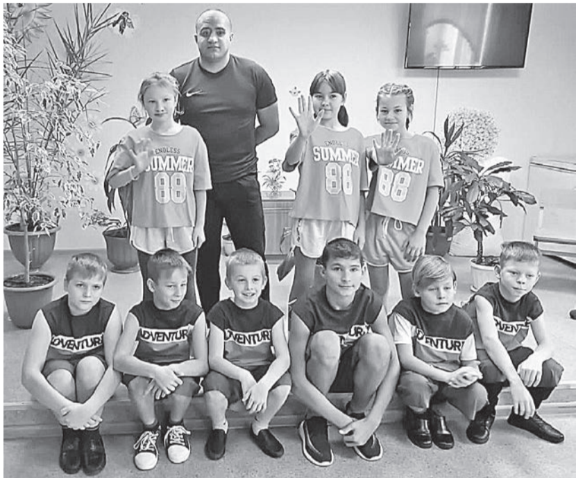
Школьники в форме, подаренной Фондом «Помогать просто»

Во время последнего звонка немало вчерашних учеников обещают не забывать учителей и дорогу в родную школу. Но потом с каждым годом детские воспоминания все больше блекнут, а для походов на вечера встреч все чаще не находится места в плотном графике взрослой жизни. Впрочем, есть в такой стандартной цепочке событий и приятные исключения, когда люди не просто интересуются судьбой своей школы, но и решают помочь ей не на словах, а на деле. Что же движет ими?